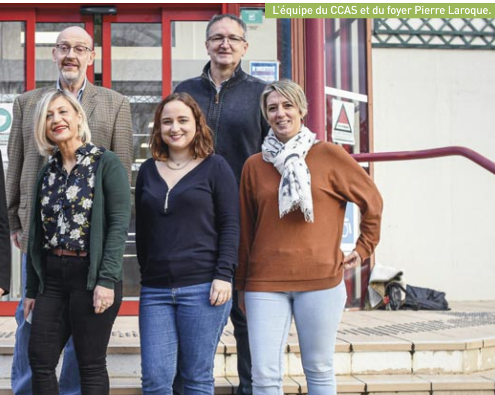
L'équipe du CCAS et du foyer Pierre Laroque.