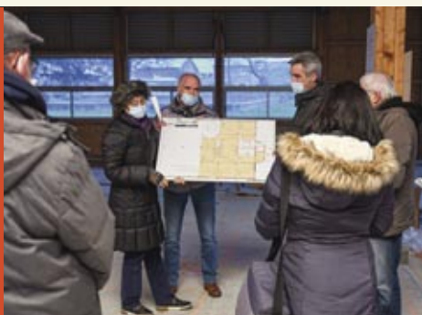
Les travaux du centre de santé municipal ont été lancés le 4 janvier.