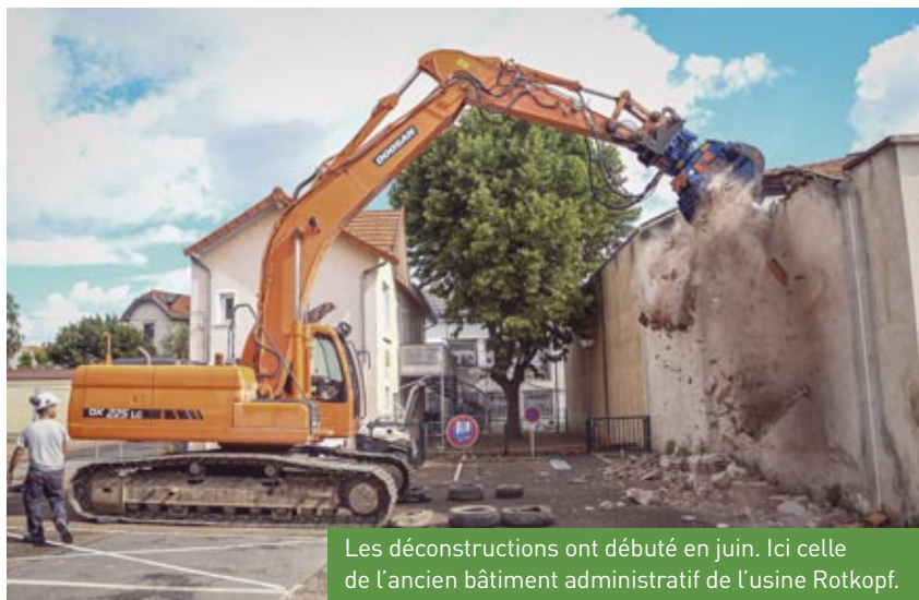
Les déconstructions ont débuté en juin. Ici celle de l'ancien bâtiment administratif de l'usine Rotkopf.