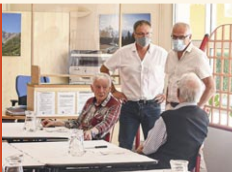
Le foyer Pierre Laroque a de nouveau accueilli les personnes âgées pour le temps du déjeuner, le 22 juin.