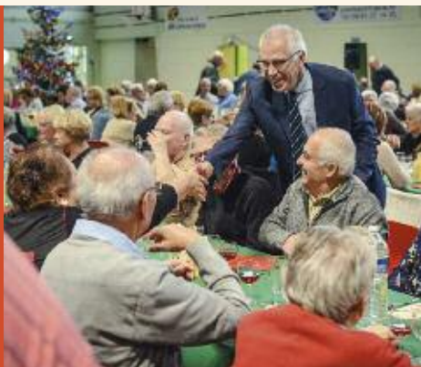
Repas des aînés, le mercredi 19 décembre 2018.