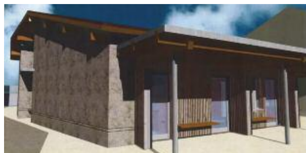
Le bâtiment bénéficiera d'un auvent.

Le chantier débutera en février, avec une livraison du local pour l'automne 2019. Le coût prévisionnel s'élève à 315 000 €. Une subvention de 90 000 € a été sollicitée et obtenue auprès du conseil départemental.