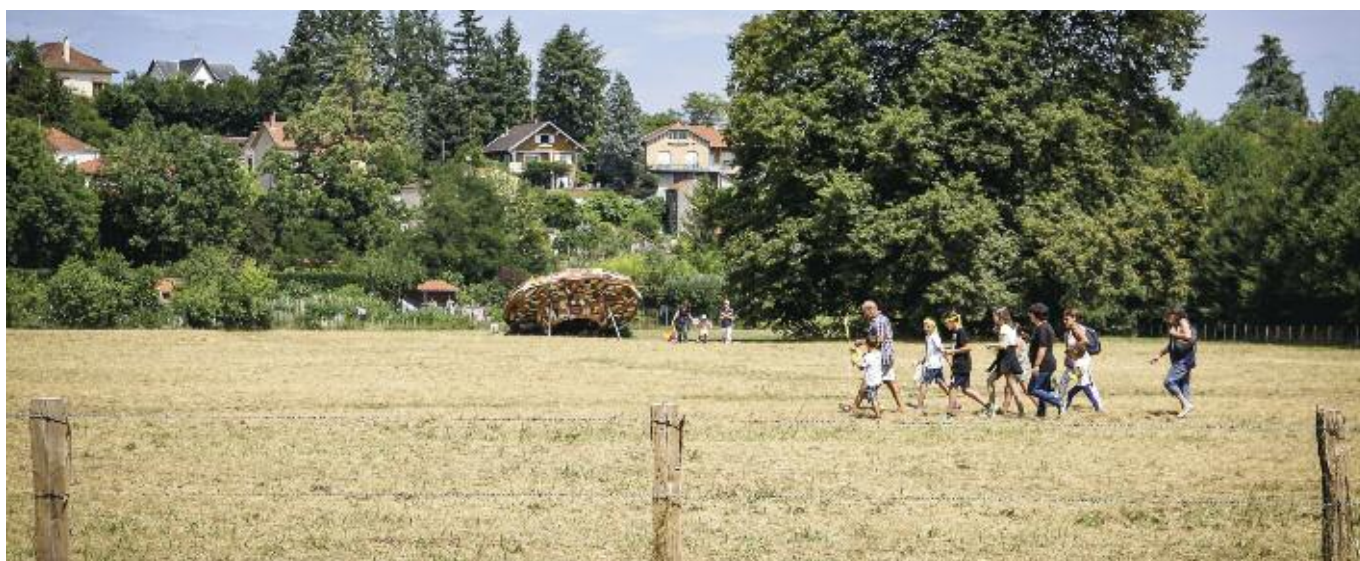
Le site accueille notamment le parcours d'art "À Ciel Ouvert", tous les deux ans.

Véritable espace naturel préservé dans la ville, la plaine de la Rivoire, qui s'étend sur près de 15 hectares, est un lieu privilégié de promenade. Afin d'améliorer l'usage récréatif et culturel, tout en protégeant le patrimoine naturel, la municipalité s'engage dans des aménagements de valorisation.