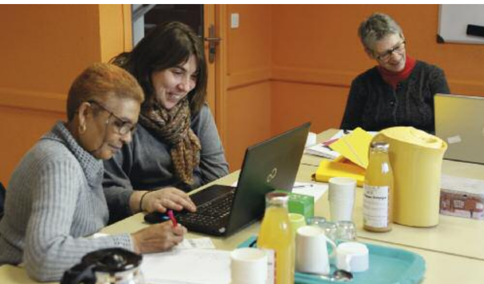
Grâce au logiciel, les participantes obtiennent le relevé de leurs habitudes de consommation.

Le secteur Actions collectives et familles du centre social, en partenariat avec l'association ARDAB (association des producteurs biologiques de la Loire et du Rhône), organisent, pour la seconde édition, un défi « Familles à alimentation positive ». L'objectif : privilégier une alimentation saine et locale, sans forcément dépenser plus.