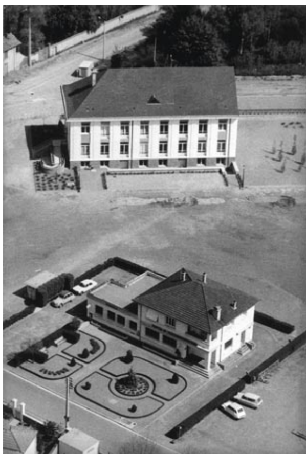
L'Hôtel de Ville vu du ciel en 1972.