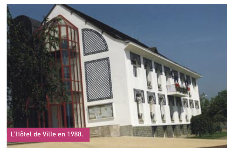
L'Hôtel de Ville en 1988.