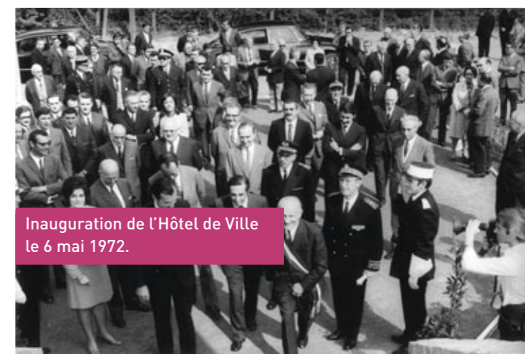
Inauguration de l'Hôtel de Ville le 6 mai 1972.