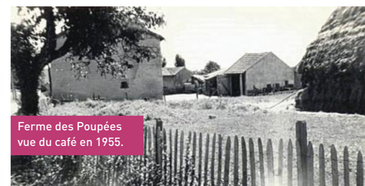
Ferme des Poupées vue du café en 1955.