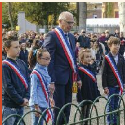
Cérémonie de commémoration du 11 novembre.