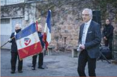
Commémoration du 56 e anniversaire de la fin de la guerre d'Algérie, le 19 mars.