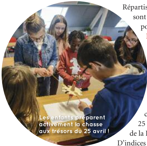
Les enfants préparent activement la chasse aux trésors du 25 avril !

APRÈS AVOIR RÉFLÉCHI À DE NOMBREUX PROJETS DURANT LEUR PREMIÈRE ANNÉE DE MANDAT, LES 20 JEUNES ÉLUS DU CONSEIL MUNICIPAL ENFANTS LES ONT MIS EN ŒUVRE DURANT CETTE DEUXIÈME ANNÉE.