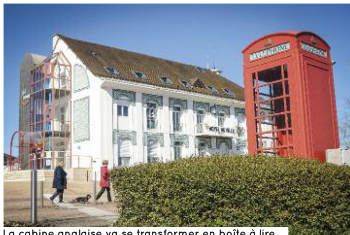
La cabine anglaise va se transformer en boîte à lire.

C'EST UNE NOUVEAUTÉ POUR RIORGES : DES BOÎTES À LIRE S'INSTALLERONT DANS LA VILLE, AU DÉBUT DU MOIS DE MAI. IL S'AGIT DE PETITES BIBLIOTHÈQUES DE RUE DANS LESQUELLES CHACUN PEUT DÉPOSER ET EMPRUNTER DES LIVRES GRATUITEMENT.