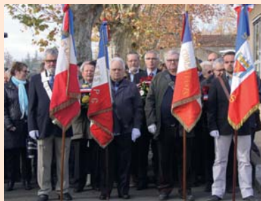
Cérémonie du souvenir, le 11 novembre.