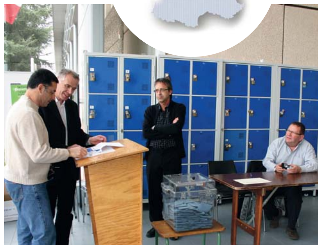
L'organisation d'un bureau conjugue les compétences du service élection et du service vie associative. Un président, deux assesseurs et un secrétaire le composent.