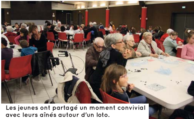
Les jeunes ont partagé un moment convivial avec leurs aînés autour d'un loto.

Lancée en 1951, la « Semaine Bleue », semaine nationale des retraités et des personnes âgées, est un moment privilégié pour informer et sensibiliser le grand public sur le rôle des seniors dans la vie économique, sociale et culturelle, mais également pour alerter sur les difficultés rencontrées au quotidien.