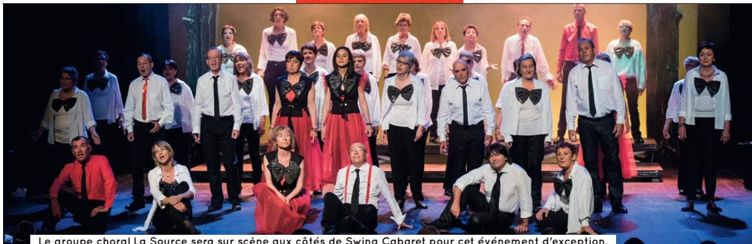
Le groupe choral La Source sera sur scène aux côtés de Swing Cabaret pour cet événement d'exception.