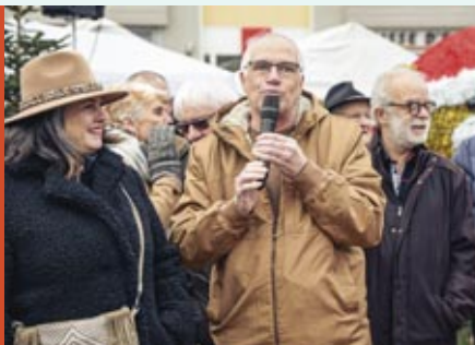
Jean-Luc Chervin, Maire de Riorges, lors de l'inauguration du Marché de Noël.